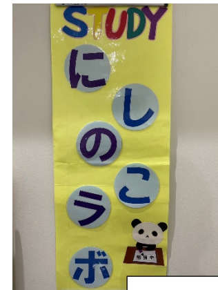
毎週火曜日実施 にしのこラボ