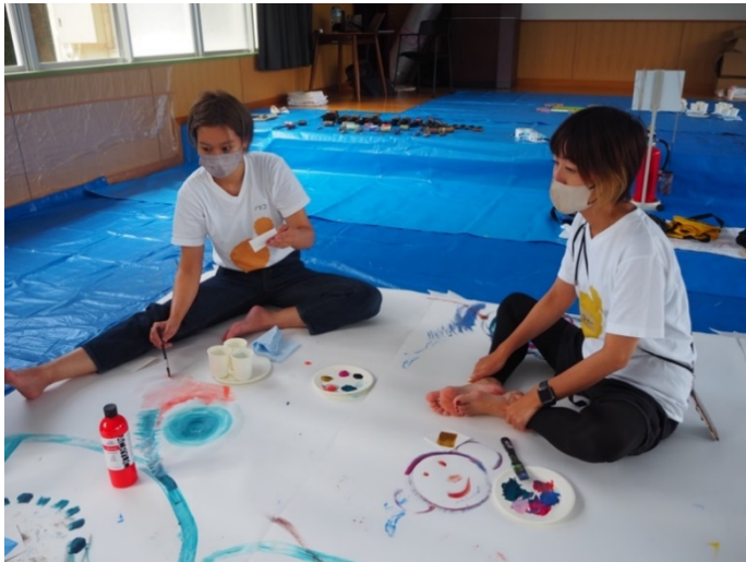
<2022年9月：親子で参加したアートワークショップの様子 @浜比嘉島>