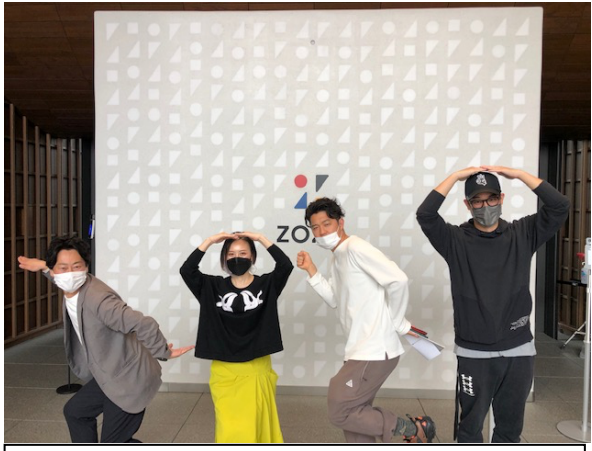
企業開拓（zozo本社で社員さんと）