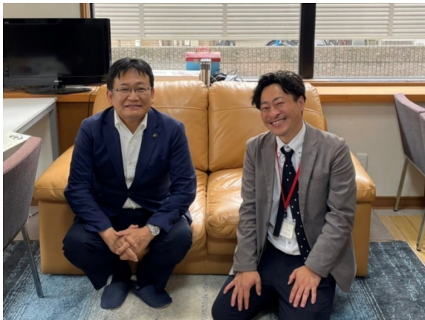
千葉市長及び千葉市役所福祉部の方がTERAKOYAを見学