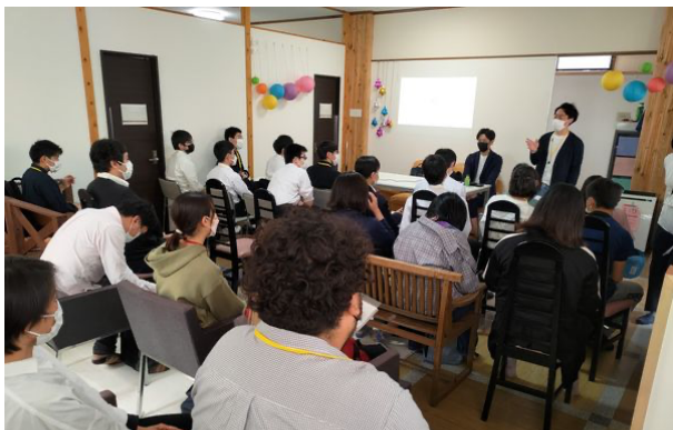
就労支援プログラム「きみらば」開催風景