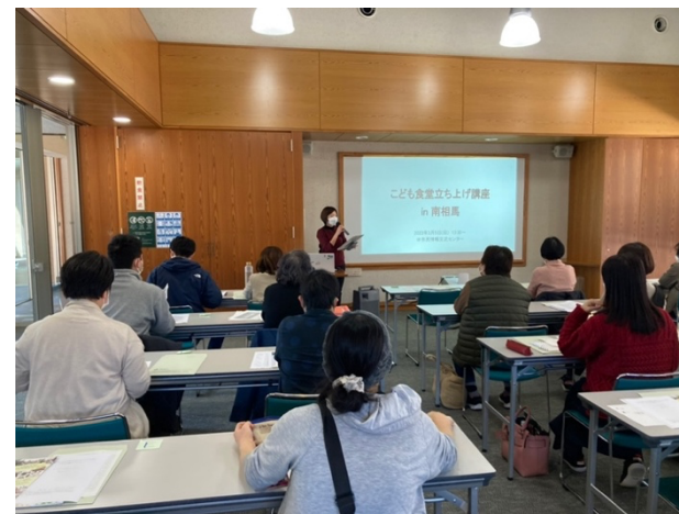
南相馬でのこども食堂立ち上げ講座