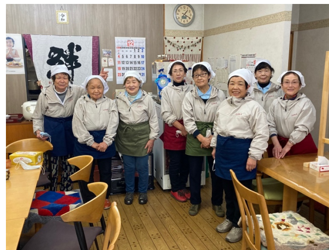
高齢者中心のこども食堂（コスモス食堂）