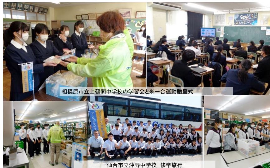
相模原市立上鶴間中学校の学習会と米一合運動贈呈式