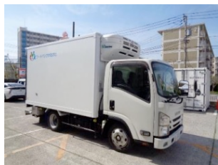
休眠預金助成金で冷凍トラック (2トﾝ車) を購入