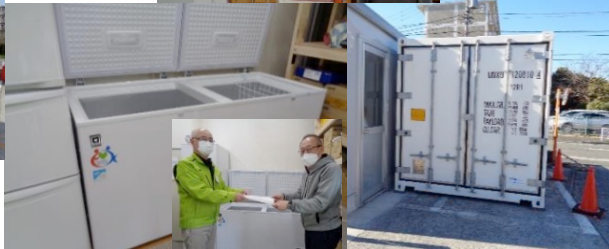
助成金にて購入した冷凍ストッカー を地域のフードバンクに無償貸与