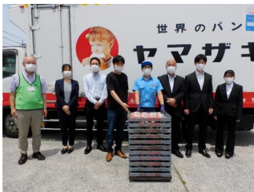
山崎製パン横浜第一工場より食パン・菓子パンなど約100個を毎日、届けて頂いています。