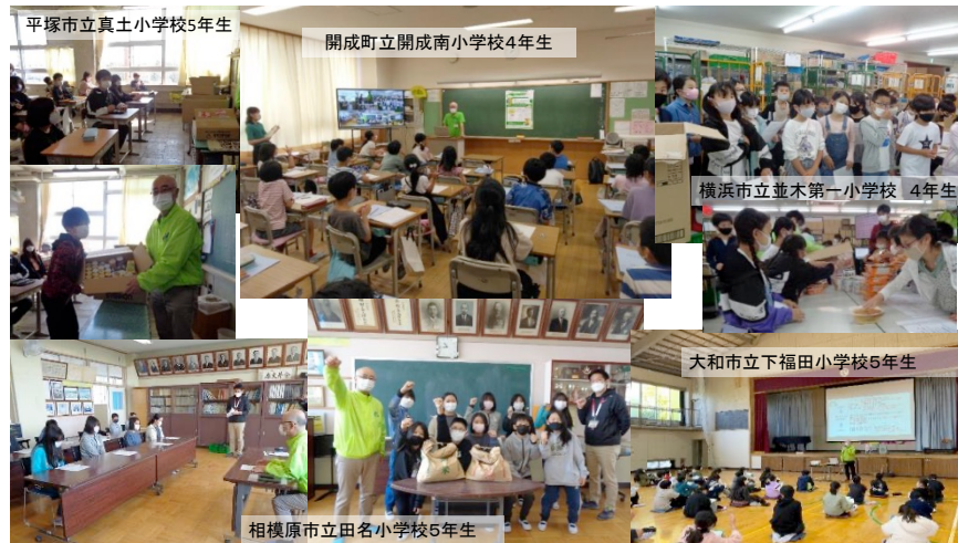
平塚市立真土小学校5年生