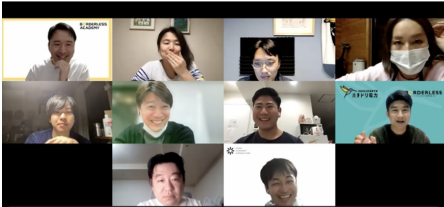
↑コミュニティでのプロジェクトアイデア会