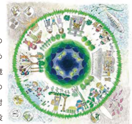
みんなかを表したマンダラアート)

みんなの家みんなかは、児童養護施設を退所し、準備不十分のまま社会に出ていかなくてはならない子どもたちの自立のために、無期限で生活環境と社会生活に必要なスキルを学ぶ環境を提供します。また、過疎化、高齢化が進む朝倉市高木地区の家を拠点とし、地域機能・産業維持が難しくなっている状況に対し、本事業の対象となる若者と一緒に活動に取り組む機会を設けることで、地域に対する貢献事業を行います。