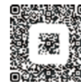
子ども若者応援寄付