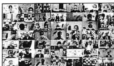
令和2年度共同募金運動開始オンライン集会

全国で新型コロナウイルスが感染拡大する中、感染対策を講じた参加形式のほか、オンライン形式により各種会議等が開催された。