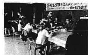
被災地での子ども食堂