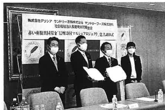
赤い羽根共同募金「信州寄付マルシェプロジェクト」発足調印式

企業・法人の社会貢献活動と連携し、地域の福祉課題の解決や持続可能なまちづくりを進めるため、寄付つき商品等の取組みを行う、赤い羽根共同募金「信州寄付マルシェプロジェクト」を新たに開始した。