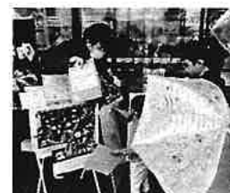
コロナ禍の街頭募金活動