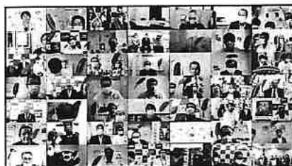
令和3年度共同募金運動開始オンライン

全国で新型コロナウイルスの感染拡大が続く中、感染対策を講じた参加形式のほか、オンライン形式により各種会議等が開催された。