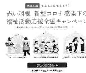
赤い羽根新型コロナ感染下の福祉活動応援全国キャンペーン