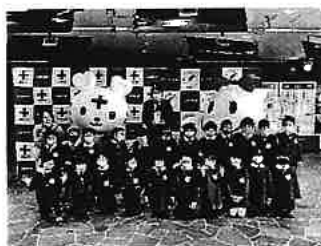
NHK歳末たすけあいキックオフイベント