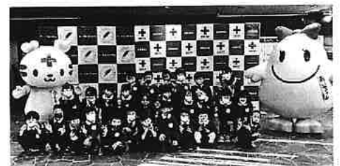
NHK歳末たすけあいキックオフイベント