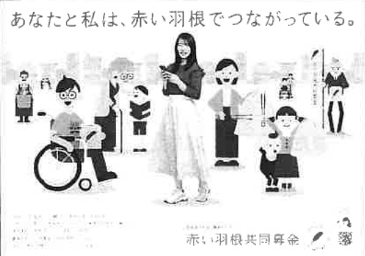
令和3年度共同募金運動ポスター

新型コロナウイルスの感染拡大が続く中、感染対策の取組みや募金活動の工夫等により令和3年度共同募金運動を実施した。また、コロナ禍の影響による日常生活に困難を抱える子どもと家族等の支援活動を行う団体に配分を実施した。